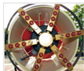
ミストノズルヘッド部