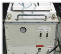
コンプレッサー部